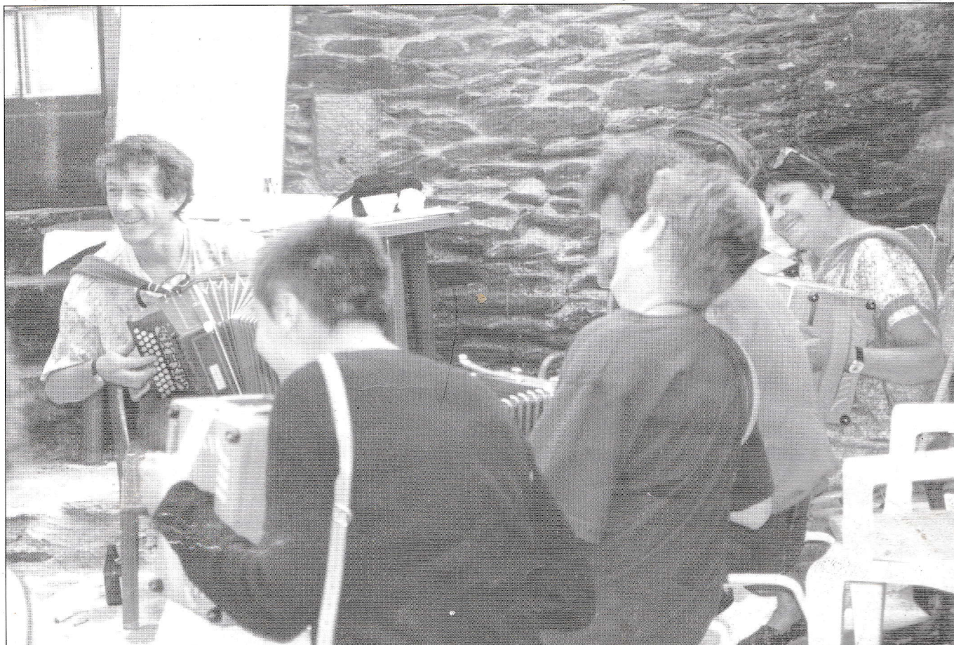
Stage à Chalap, atelier accordéon